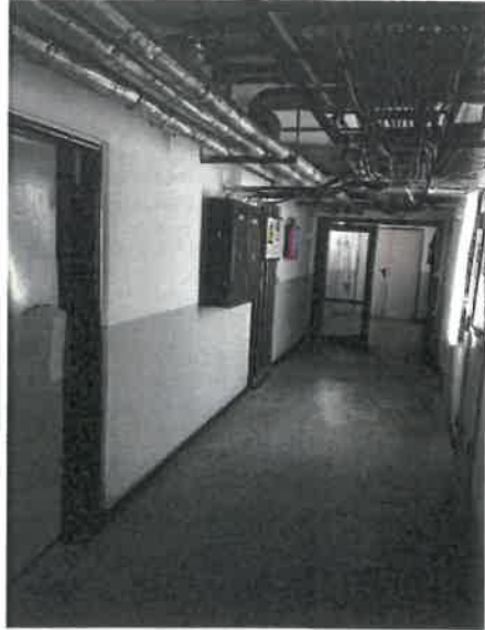
nebytový priestor v suteréne AB