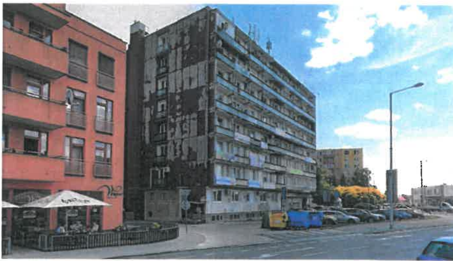
vonkajšie pohľady na administratívnu budovu súp. č. 326 na parcele č. 2390/1 v Dunajskej Strede